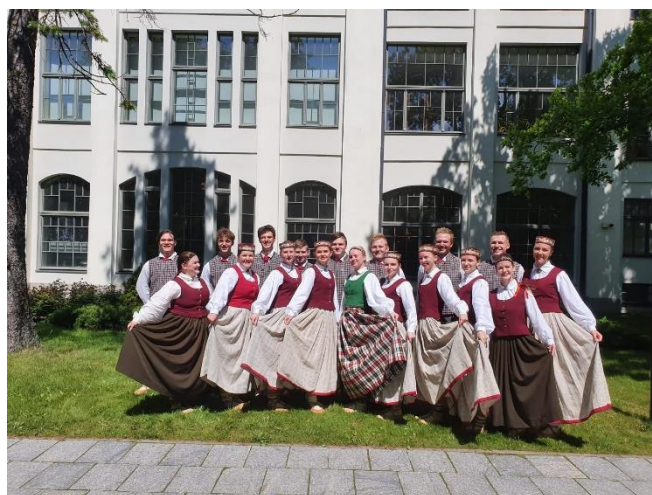
Deju kolektīvu skate kultūras pilī „Ziemeļblāzma”