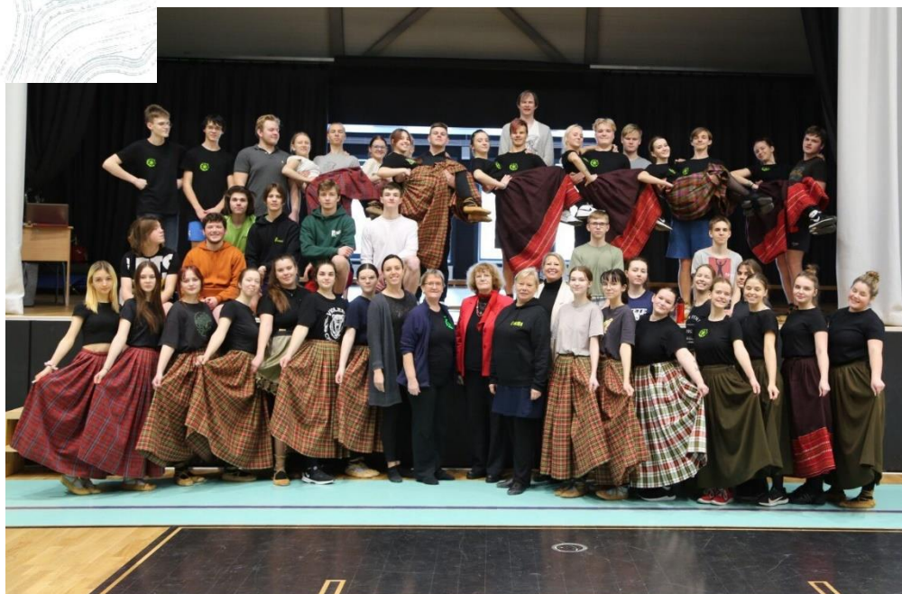
Treniņnometne Ogres tehnikumā