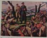
Latviešu strēlnieki pēc kaujas

Strēlnieki ir brīvības augstākās pakāpes iemiesojums, tās ir mūžiskas, patiesi "Mūžības skartas" būtnes