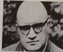
Čakam - 120