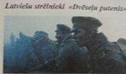
Latviešu strēlnieki «Dvēseju putenis»

Rītu kauja. Atkal. Bet jās zināt: Cīņā iet ir brīvu vīru daļa, Cīņā mirt ir brīvu vīru daļa, Lai pēc tam kā dzīva, liela cīņa Augšup celtu visu savu tautu.