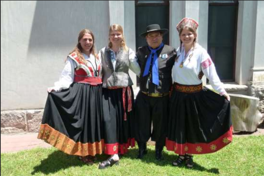
Tautas deju dejotāji