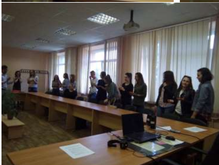
05.06.2018. K-2, K-3, K-4 grupas audzēkņi darbseminārā "Klientu datu bāzes izveide".